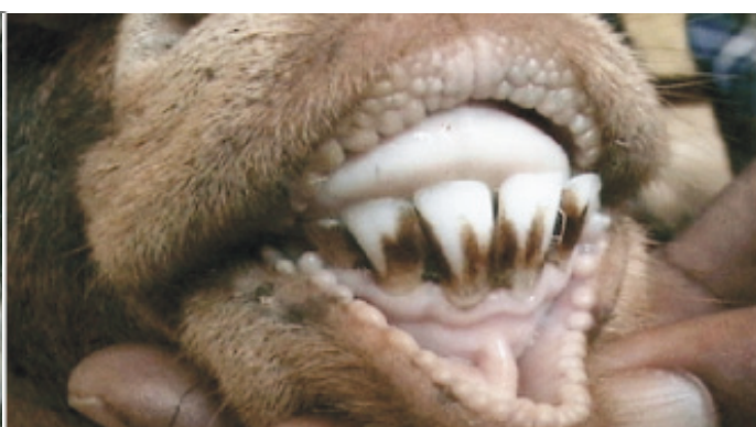
ଦ୍ୱିତୀୟ ମଧ୍ୟ ହଳ - ୨୪ - ୨୬ ମାସ (୪ ଦାନ୍ତ)