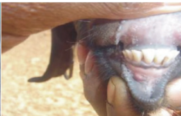
କୋଣହଳ - ୪୮ - ୫୦ ମାସ (୮ ଦାନ୍ତ)