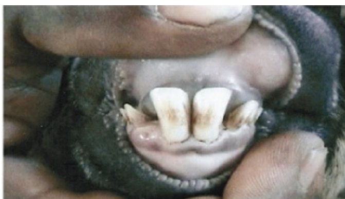
ପ୍ରଥମ ମଧ୍ୟ ହଳ - ୧୨ - ୨୪ ମାସ (୨ ଦାନ୍ତ)

ସାଧାରଣତଃ ଗୋଟିଏ ଛେଳି ୧୨ - ୧୫ ମାସ ବୟସରେ ପ୍ରଜନନକ୍ଷମ ହୋଇଥାଏ ଓ ୧୮ - ୨୦ ମାସ ବୟସରେ ପ୍ରଥମ ଥର ପାଇଁ ଛୁଆଜନ୍ମ କରିଥାଏ । ଜଣେକେହି ଛେଳିର ଦାନ୍ତ ଦେଖି ବୟସ ନିର୍ଦ୍ଧାରଣ କରିପାରିବେ । ତଳ ପାଟିରେ ଥିବା କର୍ତ୍ତନ ଦାନ୍ତକୁ ଦେଖି ଛେଳିର ବୟସ ନିର୍ଦ୍ଧାରଣ କରାଯାଇଥାଏ । ଜନ୍ମ ସମୟରେ ଛେଳି ଛୁଆର ୪ ହଳ ଦାନ୍ତ ଥାଏ ଯାହାକି ପରବର୍ତ୍ତୀ ବୟସରେ ସ୍ଥାୟୀ ଦାନ୍ତ ଦ୍ୱାରା ବଦଳ ହୋଇଥାଏ । ଏହି ସ୍ଥାୟୀ ଦାନ୍ତ ଉଠିବା ଛେଳିର ଖାଦ୍ୟର ପ୍ରକାର, ଖାଦ୍ୟ ଖାଇବା ପ୍ରଣାଳୀ ଓ ପରିଚ୍ଛଳନା ବ୍ୟବସ୍ଥା ଉପରେ ନିର୍ଭର କରିଥାଏ । ସ୍ଥାୟୀ ଦାନ୍ତ ବାହାରିବା ପରେ, ଦାନ୍ତ ଘୋରି ହେବାକୁ ଲକ୍ଷ୍ୟ କରି ଛେଳିର ଆନୁମାନିକ ବୟସ ଜାଣିପାରିବା । ସମ୍ପୂର୍ଣ୍ଣ ୪ ହଳ ଦାନ୍ତ ବାହାରିବାର ୫ - ୬ ସପ୍ତାହ ପରେ ଦାନ୍ତ ଘୋରି ହେବା ପରିଲକ୍ଷିତ ହୁଏ ।