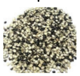
ଚୁନି (ଡାଲି ଜାତୀୟ)

ସମନ ପ୍ରମାଣରେ ଉପରୋକ୍ତ ଖାଦ୍ୟରୁ ୨ ମାସ ପର ଠାରୁ ଛୁଆଙ୍କ ପାଇଁ ଦୈନିକ ୫୦ ଗ୍ରାମ୍ ଆରମ୍ଭ କରି ଆସ୍ତେ ଆସ୍ତେ ବୃଦ୍ଧି କରିବା ଆବଶ୍ୟକ । ୬ ମାସ ପରେ ବଡ଼ ଛେଳି ମେଣ୍ଟା ମାନଙ୍କୁ ୧୦୦ ଗ୍ରାମ୍ ଏବଂ ମା ଛେଳି ମେଣ୍ଟା ମାନଙ୍କୁ ୧୫୦ ଗ୍ରାମ୍ ହିସାବରେ ଖାଇବାକୁ ଦେବାକୁ ହେବ ।