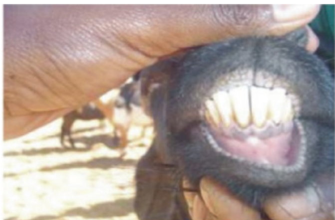
ତୃତୀୟ ପାର୍ଶ୍ୱହଳ - ୩୬ - ୩୮ ମାସ (୬ ଦାନ୍ତ)