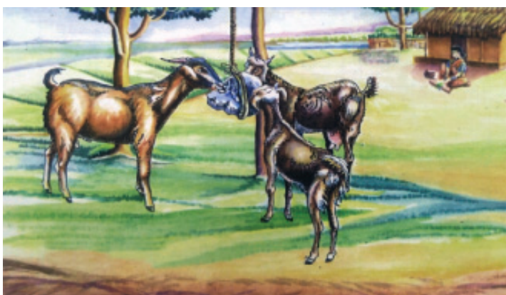
ଚାଟିବା ପାଇଁ ପଥର ଲୁଣ